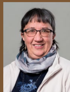
Regieassistentz: Marianne Schiess