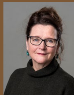
Regie: Renate Adam